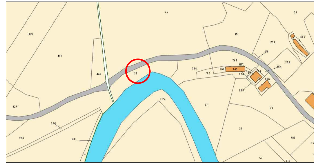
Catastale (Fig. 27)