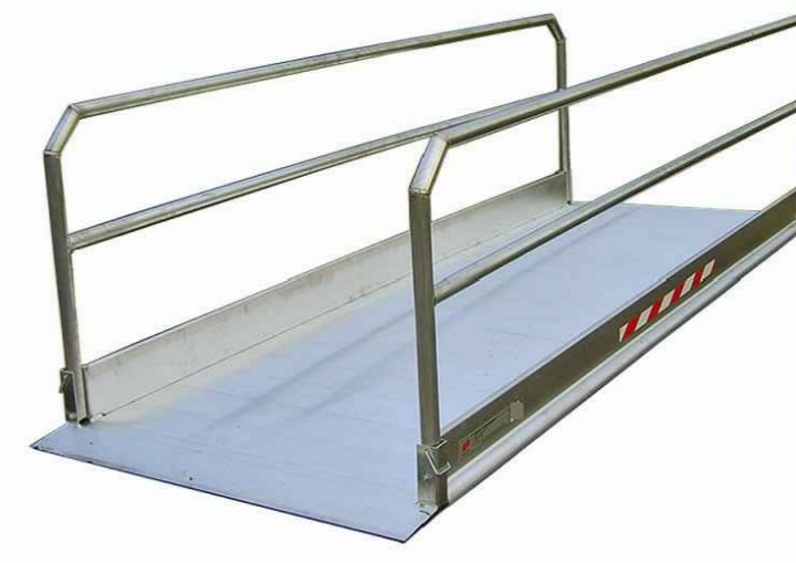
DETTAGLIO PASSERELLA MOBILE