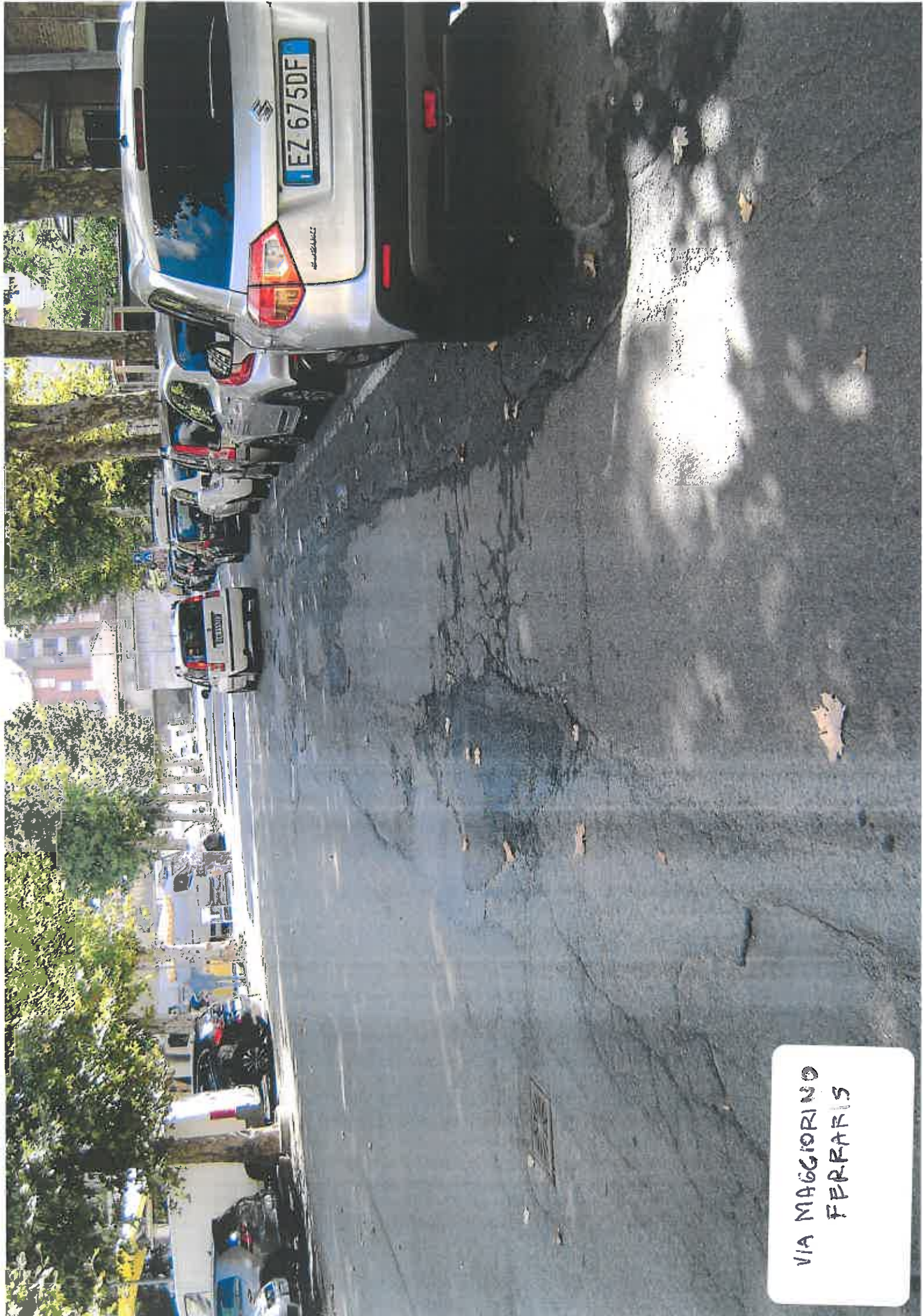
VIA MAGGIORINO FERRARIS