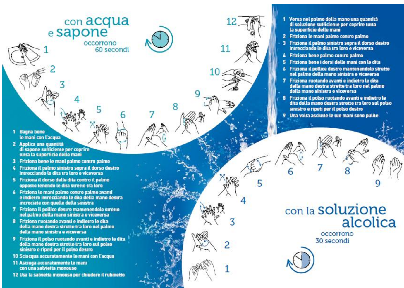
Riferimento 1 – ALLEGATO 4

Per le tecniche di dettaglio “ Lavaggio delle mani ” si rimanda alle infografiche “ Riferimento 1 e 2 dell'ALLEGATO 4 ”. Di seguito si riportano le rappresentazioni infografica in formato ridotto: