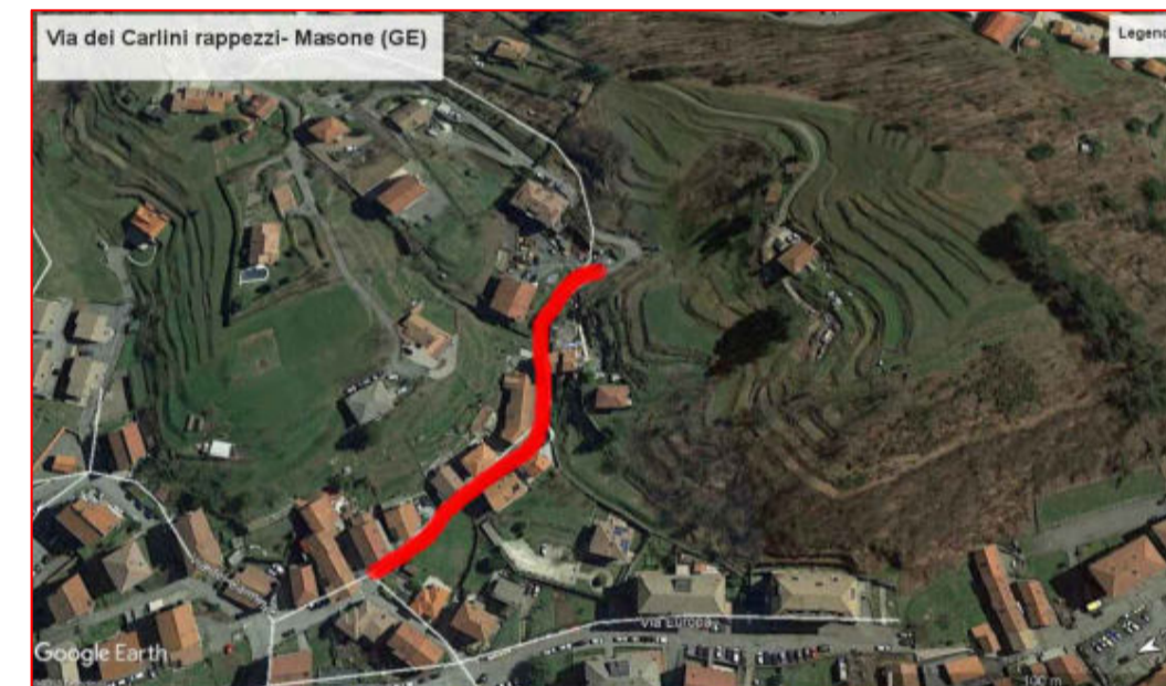
Via dei Carlini