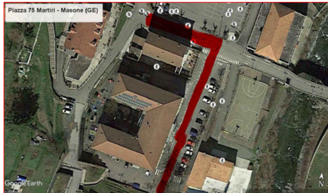
Piazza 75 Martiri

LAVORI "Lavori di manutenzione straordinaria alla viabilità comunale - Asfalti delle sedi stradali in più vie - anno 2019"