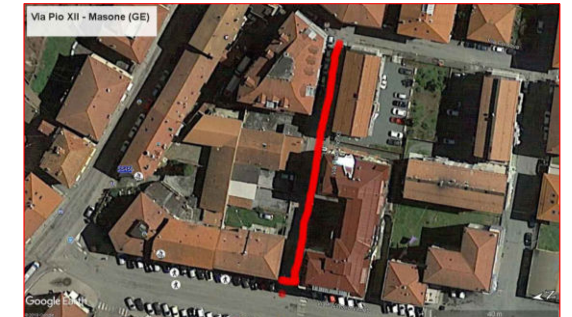
Via Pio XII