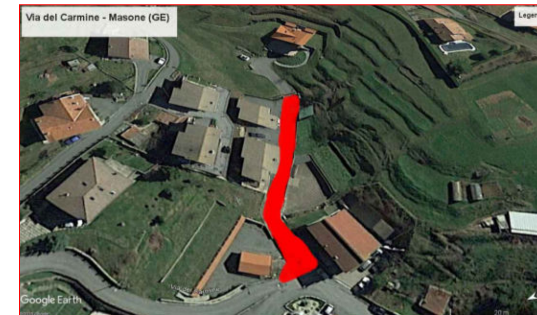
Via del Carmine