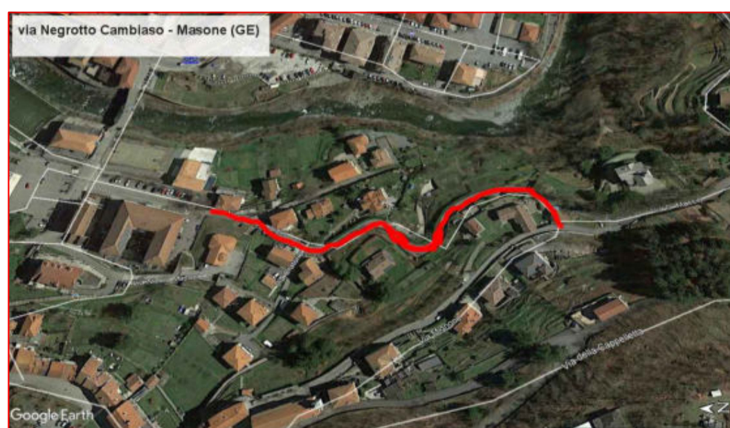
Via Negrotto Cambiaso