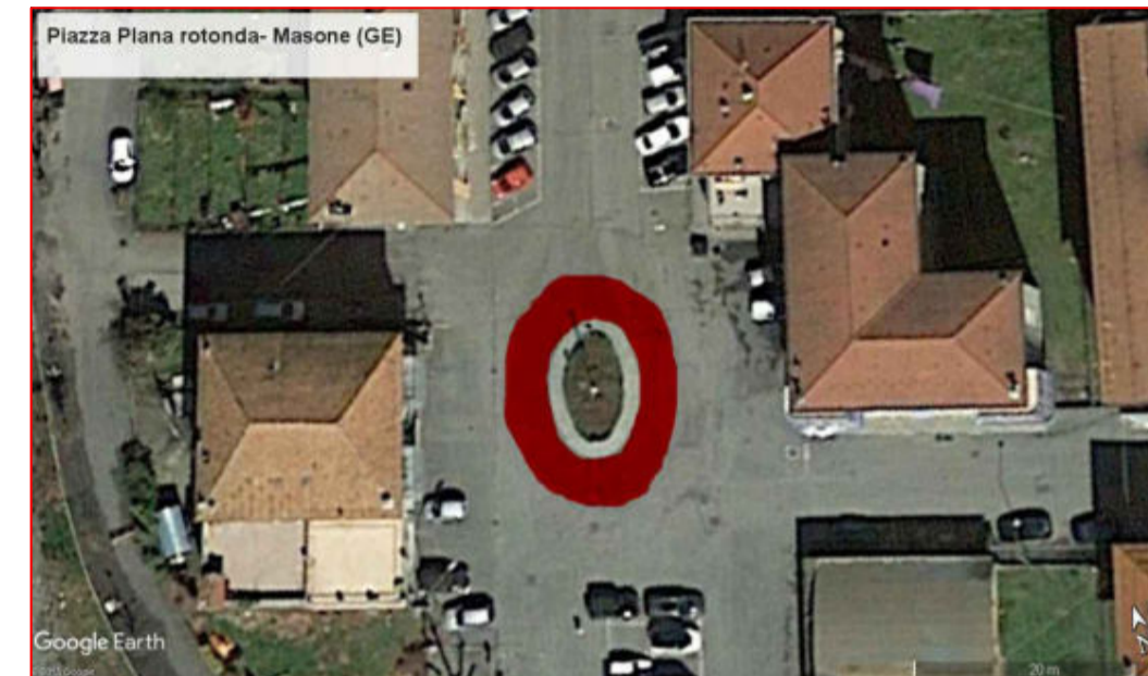
Piazza Vittorio Veneto